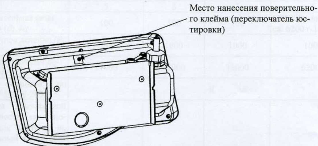
Рисунок 2 - Место нанесения поверительного клейма.

[D] - (если присутствует) означает, что весы оснащены цифровым показывающим устройством, с уменьшенным в 10 раз делением, в диапазоне от 0 до 6200 г включительно.