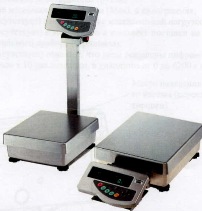
Рисунок 1 - Общий вид весов неавтоматического действия Н1.

Принцип действия весов основан на преобразовании частоты вибрации акустического весоизмерительного датчика, возникающей при его растяжении или сжатии под действием взвешиваемого груза, в цифровой электрический сигнал, изменяющийся пропорционально массе взвешиваемого груза. Результаты взвешивания выводятся на дисплей.